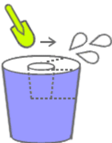
④ショベルで横穴を掘ります。