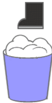
②足で踏みつけて、しっかり雪を固めます。