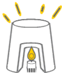
⑤ひっくり返し、バケツから外して、中にキャンドルを入れます。