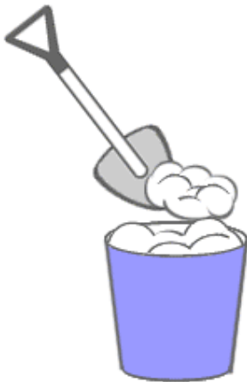
①バケツに雪を入れます。